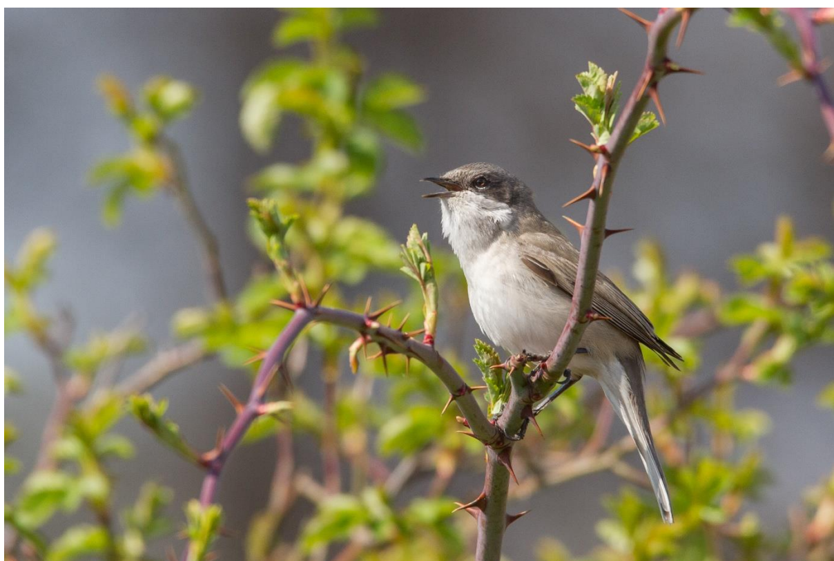
Braamsluiper, doelsoort in de droge dooradering